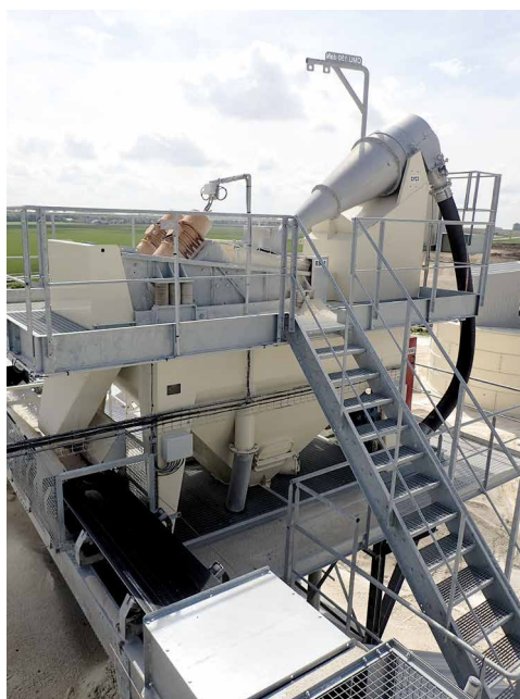
Ensemble de traitement de sable simple cyclonage.