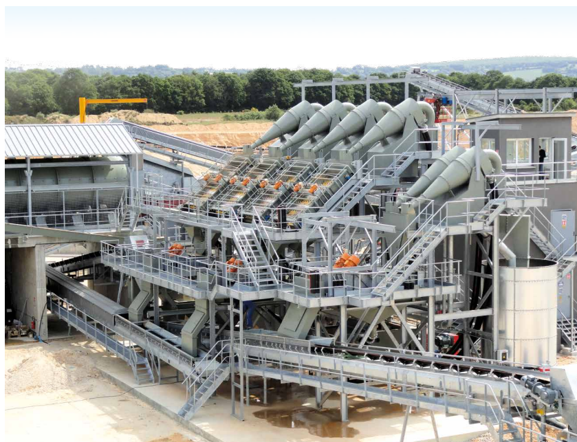
Ensemble de traitement de sable avec coupure et recombinaison.